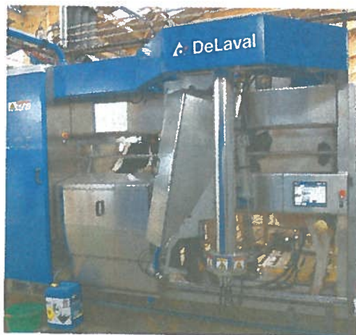
> A voir 2 robots de traite VMS Delaval delpro 4.2, en circulation libre contrôlée.